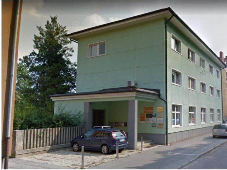
pogled na poslovno stavbo, v kateri so pisarne, ki so predmet zbiranja ponudb

GOZDNO IN LESNO GOSPODARSTVO MURSKA SOBOTA d.o.o. Ul. arhitekta Novaka 17, 9000 M. Sobota, tel: (02) 521 48 60 fax: (02) 521 48 71, elektronska pošta: glgms@sioi.net