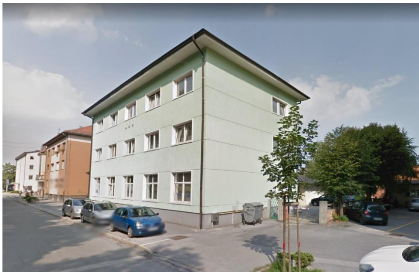
pogled na poslovno stavbo, v kateri so pisarne, ki so predmet zbiranja ponudb, z uvozom na parkirišče za poslovno stavbo

Predmet prodaje so: pisarne v pritličju etažirane stavbe št. 797, zgrajene leta 1954 na naslovu Ulica arhitekta Novaka 17 v Murski Soboti, s skupno uporabno površino 105,90 m 2 , pisarne v 1. nadstropju s skupno uporabno površino 195,20 m 2 , skladiščn prostor z uporabno površino 101,40 m 2 v stavbi št. 798 za poslovno stavbo, ter uvoz do parkirišča za poslovno stavbo 797, ki poteka po parc. št. 1223/3 k.o. Murska Sobota, s površino 95 m 2 . Stavba št. 797 je bila v celoti prenovljena leta 2007. Pisarne, ki so predmet zbiranja ponudb, so opremljene z električnimi instalacijami, ITK instalacijami, centralnim ogrevanjem ter dobro vzdrževane. Do pisarn v 1. nadstropju vodi dvoramno stopnišče.