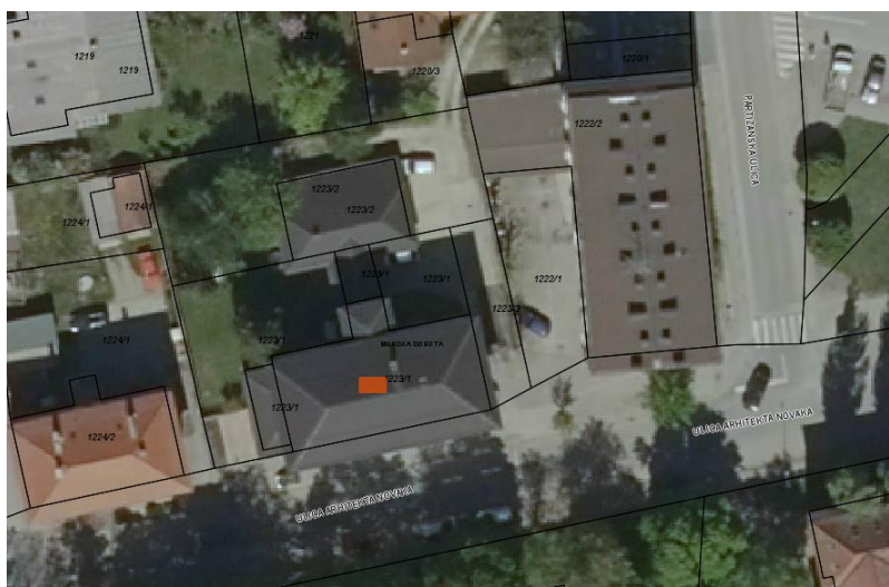
pregled na celoto in lego nepremičnin, ki so predmet zbiranja ponudb