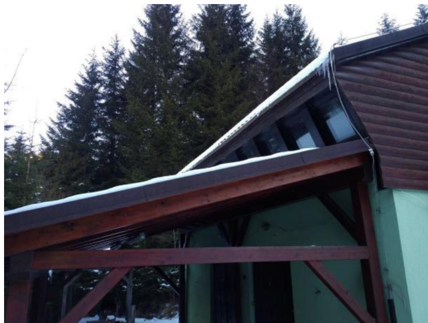
detajl objekta, ki je predmet zbiranja ponudb

Stavba je bila zgrajena leta 1988 v klasični izvedbi z masivno opečno konstrukcijo ter dvokapnico, pokrito s pločevinasto kritino s posipom. Fasada je ometana, ogrevanje centralno (na plin – plinska postaja). Okna so lesena s polkni in termopan zasteklitvijo. Na strehi je strelovod. Stavba je priključena na elektro omrežje. Oskrba z vodo je urejena z lastnim vodnim zajetjem, kanalizacija speljana v greznico. Stavba je opremljena z anteno za satelitsko televizijo. Leta 2000 je bila v celoti obnovljena (od oken, vrat, vhodnih vrat, tlakov, do nove kritine).