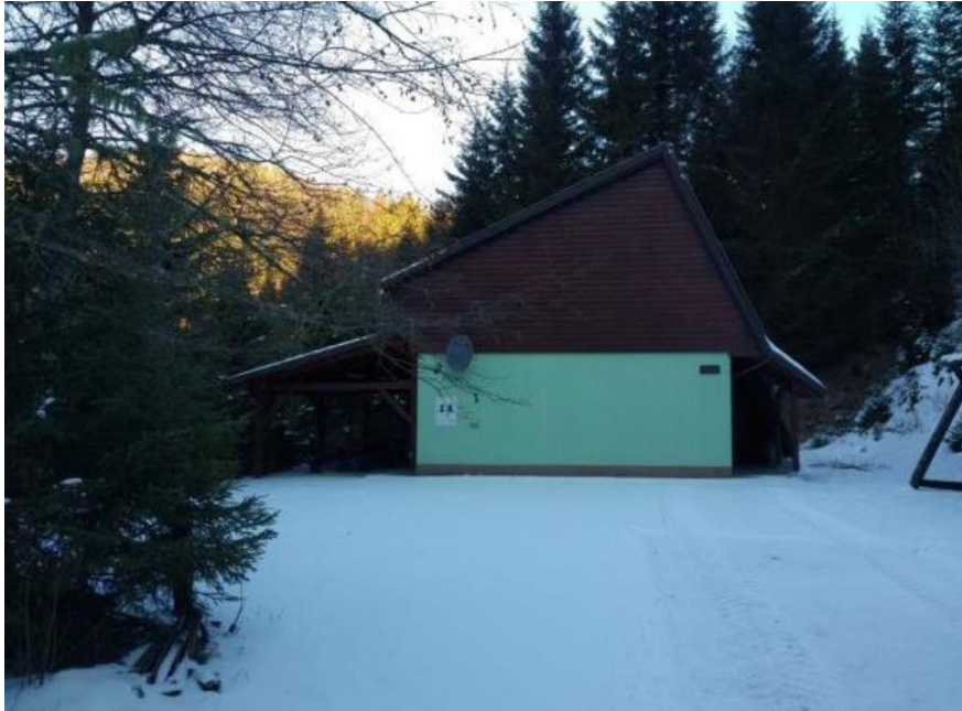
pogled na objekt, ki je predmet zbiranja ponudb

Nepremičnina v naravi predstavlja zidano stavbo z uporabno površino 88,6 m 2 z etažnostjo P+M na parceli št. 1488/20 k.o. 725 KOT s površino 684 m 2 .