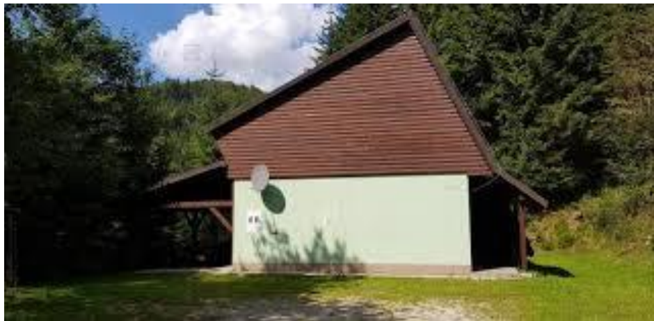
pogled na objekt, ki je predmet zbiranja ponudb

objekt Jurgovo (nekdanja logarnica) – stavba št. 32 (po podatkih GURS) z uporabno površino 88,6 m 2 na zemljišču parc. št. 1488/20 k.o. 725 KOT s površino 684 m 2 , namenska raba lege nepremičnine: površine razpršene poselitve.